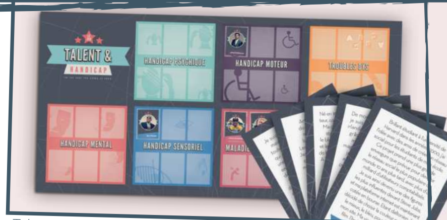
Talents et handicap